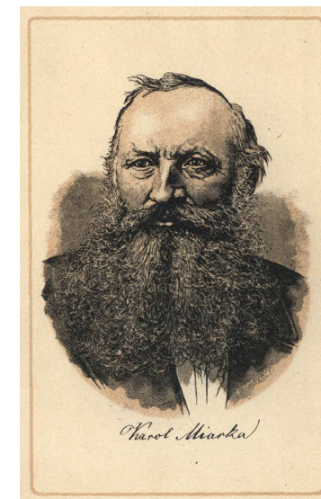
Karol Miarka (1825–1882) – nauczyciel, obrońca mowy polskiej, pisarz, publicysta, działacz oświatowy, społeczny i narodowy, wydawca najbardziej popularnego na Śląsku czasopisma „Katolik”.